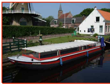
Gantel 6 (max. 32-38* p.)