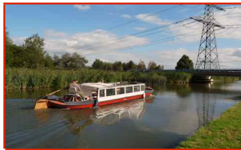
Gantel 4 (max. 22* p.)

*maximum aantal personen volgens certificaat I.L.T.